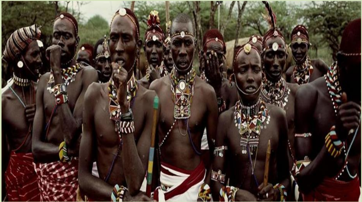
Προετοιμασία των ανδρών μιας φυλής για να συμμετέχουν σε τελετή.

επανάληψης κάποιας μυθικής πράξης (π.χ. της κοσμογονίας), προσφοράς, θυσίας.