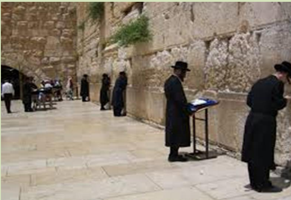
Εβραίοι προσεύχονται μπροστά στο τείχος των δακρύων

Το τείχος των δακρύων-«Κότελ»: ετούτο το τείχος δεν ανήκει ακριβώς στον πρώτο ναό του Σολομώντα, αλλά στο ανακατασκευασμένο ναό που έχτισε στο ίδιο ακριβώς σημείο ο Ηρώδης, το 20 μ.Χ. Τον 16ο αιώνα, όταν ακόμα η περιοχή ανήκε στην Οθωμανική Αυτοκρατορία, οι Εβραίοι άρχισαν να μαζεύονται σε ετούτο το μέρος για να προσευχηθούν και να θρηνήσουν για την απώλεια του ναού τους. Εξού και η ονομασία Τείχος των Δακρύων.